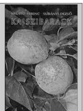
A metszés részletes szabályai Nyíjtó Ferenc-Surányi Dezső: Kajsziarack című könyvében (Mezőgazdasági Kiadó, Budapest, 1981) olvashatók el.

A kajsziarackfa a szőlővel azonos talajokat kedvelik; a homokon és az agyagtalajokon egyaránt megélnék. Kezdetben felfelé törekvő, később ellaposodó, emyőszerű koronát fejlesztenek, ezért legalább 6x6 méteres tenyészterületre (36 m 2 ) van szükségük. A lombkorona nem ad mély árnyékot, ezért a fák alatt a szamóca, sőt a zöldségfélék is megtermelhetők.